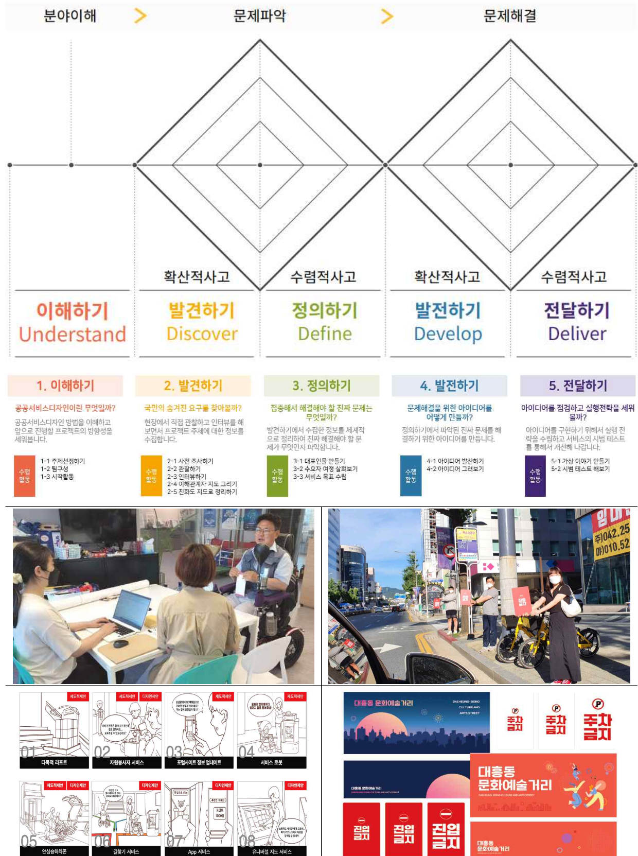
붙임 1. 2022 도시문제해결형 디자인 리빙랩 성과 도록