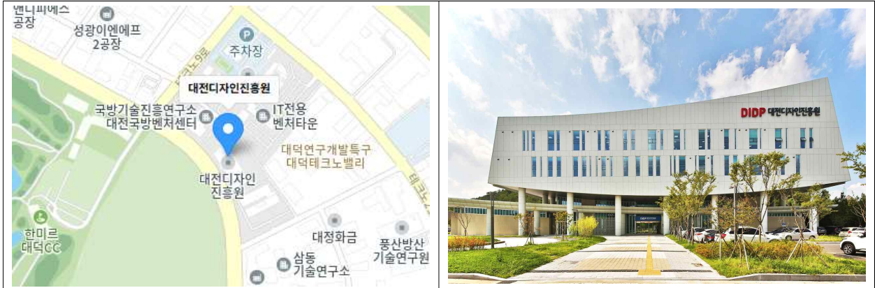
【대전디자인진흥원 오시는 길】

주소 : 대전 유성구 테크노중앙로 227, 대전디자인진흥원 대중교통안내 : 701번, 705번, 마을 1번, 첨단 1번